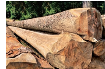
Holz und Holzprodukte

Mit ihrem Honig schenken uns Bienen Wohlgeschmack und Gesundheit. Er ist gut bekannt als altes Hausmittel bei Erkältungen. Ohne Bienen, die hauptsächlich für die Bestäubung der Obstbäume und Beerensträucher verantwortlich sind, wäre es um die Obsternte schlecht bestellt. Deshalb ist die Arbeit der Imker von so großer Bedeutung. Auf Blumenwiesen, in Obstgärten und Wäldern in der Region finden Bienen noch einen reich gedeckten Tisch. Je nach Jahreszeit und Gegend gibt es im Achantal den so wertvollen Blüten- und Waldhonig. Imker bieten auch Produkte wie Honigwein, Kerzen, Pollen und Propolis an.