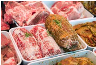
Fleisch und Wurst von gesunden Rindern

Im Achantal werden viele Produkte erzeugt. Durch die traditionelle Milchviehhaltung gibt es vor allem Rindfleisch und Milch. Aber auch eine Reihe anderer schmackhafter und guter Produkte werden erzeugt und verarbeitet. Erzeugnisse mit dem Zeichen „Qualität Achantal“ werden naturnah hergestellt. Vorteil für den Käufer: Er weiß, wie und wo die Produkte entstehen. Direkt beim Erzeuger kann die Herstellung miterlebt werden.