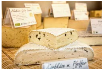
Milch, Butter und Käse

Rinder auf der Talweide und Jungvieh auf den Almen gehören zur Tradition im Achantal. Saftige Wiesen mit vielen Alpen- und Heilkräutern sind Grundlage einer artgerechten Aufzucht. Die Tiere dürfen sich frei bewegen und langsam wachsen. Ohne lange Transportwege wird das Fleisch der Tiere handwerklich verarbeitet. Fleisch und Wurst der so gehaltenen Tiere haben eine hohe Qualität und dürfen das Zeichen „Qualität Achantal“ tragen. Die besonderen Wurstwaren haben einen hohen Rindfleischanteil. Rindfleisch ist ein wichtiger Eiweißlieferant für unsere Gesundheit. Regionale Rindfleischprodukte sind erhältlich bei den heimischen Metzgern, auf dem Bauernmarkt, direkt ab Hof oder wohlschmeckend zubereitet in der Gastronomie.